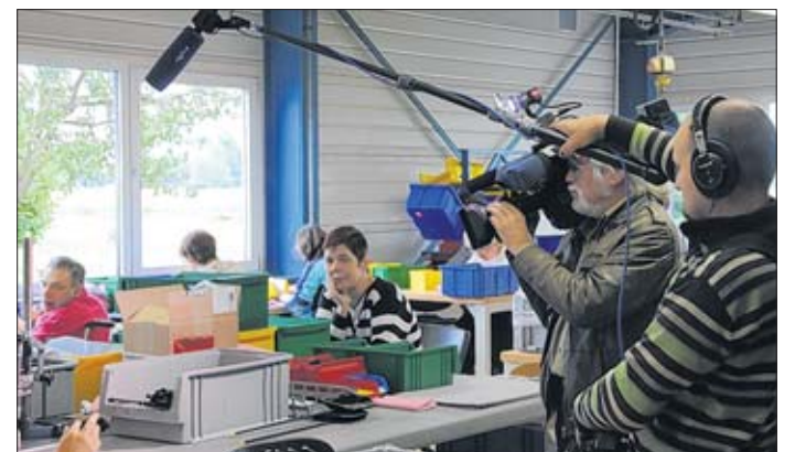
Ein Kamerateam im Bodelschwing-Haus.

die Werkstattbereiche und erklärte, warum der Ersatzdienst in der Behindertenhilfe nur wenig Sinn macht: „Wir können Unterstützung gebrauchen, das ist nicht die Frage. Es ist aber eine lange Einarbeitungszeit erforderlich, bis Beschäftigte und Betreuer Vertrauen zueinander aufgebaut haben.“ Mit der Verkürzung auf sechs Monate sei das nicht mehr realisierbar.